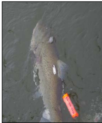
Truite brune remise à l'eau dans le lac Ontario après un marquage réussi à l'aide d'une ESDA.

Cette dernière année, l'Université Windsor et le MRNFO ont reçu une subvention de la Commission des pêcheries des Grands Lacs pour étiqueter le saumon quinnat, la truite arc-en-ciel, le touladi et le saumon de l'Atlantique à l'aide d'étiquettes de stockage de données amovibles (ESDA). Ces