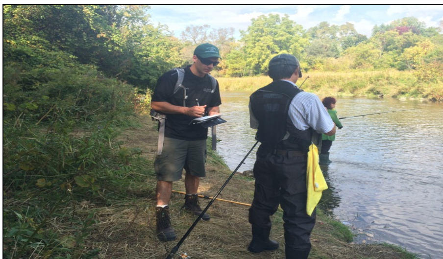
Employé du ministère des Richesses naturelles et des Forêts de l'Ontario posant des questions à un pêcheur à la ligne dans le cadre d'un sondage sur les affluents du lac Ontario.

En 2015, les responsables du Partenariat du lac Ontario ont continué leurs efforts visant à examiner les importants facteurs de stress dans l'ensemble du lac et ont collaboré en vue de protéger et de restaurer la qualité de l'eau et la santé de l'écosystème. Cela a été rendu possible grâce à la mise en œuvre d'un train de mesures et de programmes prioritaires, dont la Stratégie binationale de conservation de la biodiversité (SBCB), l'Initiative de coopération pour la science et la surveillance (ICSS), la réduction des polluants critiques, le rétablissement des espèces de poisson et d'un réseau trophique productif, l'amélioration de la qualité de l'environnement des écosystèmes des zones riveraines et des terres humides côtières ainsi que la réalisation d'activités de sensibilisation et de communication.