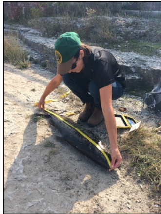
À droite : Membre du personnel du MRNFO recueillant des renseignements biologiques sur un saumon quinnat.

Cette dernière année, l'Université Windsor et le MRNFO ont reçu une subvention de la Commission des pêcheries des Grands Lacs pour étiqueter le saumon quinnat, la truite arc-en-ciel, le touladi et le saumon de l'Atlantique à l'aide d'étiquettes de stockage de données amovibles (ESDA). Ces