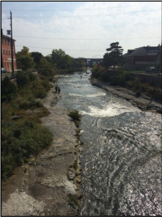
À gauche : Pêcheurs à la ligne pêchant dans la rivière Ganaraska, Port Hope (Ontario).