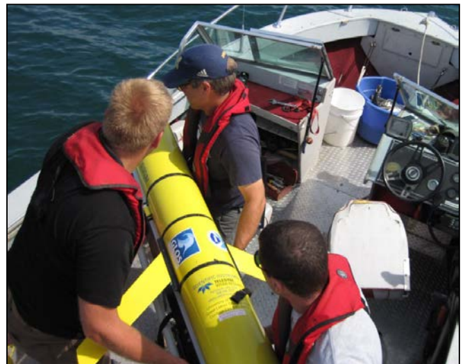
Lancement du planeur CILER dans le lac Ontario, le 31 juillet 2013, près d'Oswego, N.Y.

Une meilleure compréhension de la dynamique de la CPC viendra s'ajouter aux travaux récemment réalisés sur les gradients entre les zones côtières et extracôtières par l'USGS, Environnement Canada (EC), le MRNFO et l'Université Windsor. Depuis l'invasion des moules zébrées et quaggas, les réseaux trophiques aquatiques du lac Ontario dépendent de plus en plus des processus écologiques observés dans les eaux profondes des zones extracôtières et des zones côtières plutôt que dans les eaux de surface extracôtières.