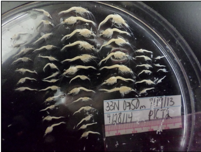
Échantillon de M. diluviana prélevé le 19 juillet 2013.

Pendant l'ICSS de 2013, les scientifiques ont découvert que la mysis continue d'utiliser les niveaux de lumière et la température pour choisir la profondeur où elles prendront leur repas nocturne. Selon de récentes estimations, le lac abrite 7 000 tonnes métriques de mysis pendant l'échantillonnage de l'été, ce qui représente une énorme conversion de ressources de plancton en une biomasse haute en énergie disponible pour les petits poissons dont se nourrissent les plus gros poissons, tels que le touladi et le saumon.