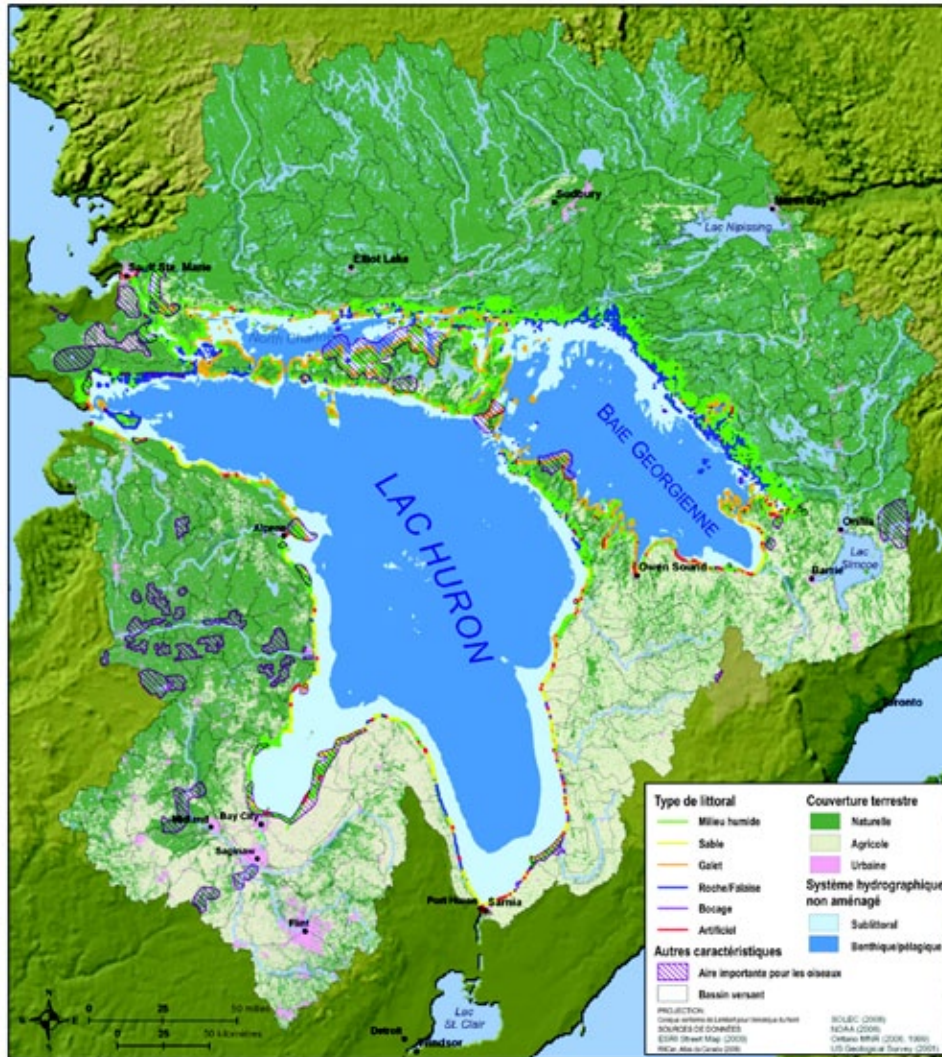
Carte : The Nature Conservancies des États-Unis et du Canada.

La gestion efficace des eaux libres et littorales, des écosystèmes de milieux humides côtiers et des écosystèmes terrestres côtiers, des îles, des espèces migratrices volantes ainsi que des poissons migrateurs indigènes assurera la conservation de la biodiversité indigène du lac Huron.