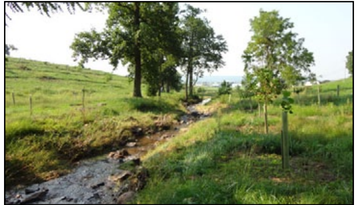
Projet de remise en état d'un ruisseau.

La réduction de la pollution de sources diffuses est également une priorité pour les membres du Partenariat binational du lac Huron de même que pour les agences et les participants locaux qui collaborent afin d'aborder des enjeux au Canada et aux États Unis. Au Canada, au cours des 30 dernières années, on a observé une hausse importante de la présence et de la quantité d'algues visibles dans les zones littorales du rivage sud est.