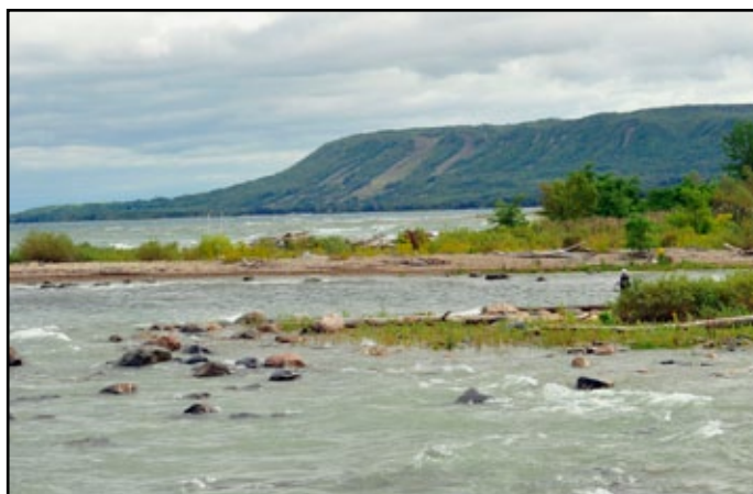
Plage Northwinds à Craigleith, en Ontario.

On procède continuellement à des améliorations de la gestion panlacustre. À ce jour, les domaines prioritaires sont les objectifs liés à l'écosystème du lac, les plans de sensibilisation et de consultation, les plans d'aménagement panlacustre (PAAP) et la gestion des eaux littorales. Pour de plus amples renseignements, consultez le site suivant : http://binational.net/fr/ . ♦