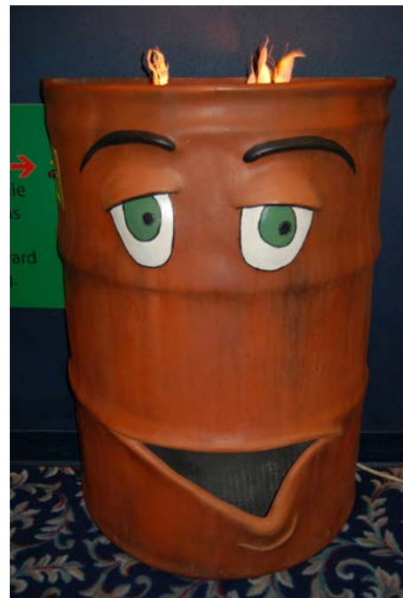
Bernie le baril à brûler incite les gens à cesser l'incinération des déchets à la maison.

Le site Web nouvellement conçu du Forum binational du lac Supérieur se trouve à l'adresse www.superiorforum.org [en anglais seulement]. Ce site Web est une excellente ressource renfermant des renseignements et des discussions à propos des questions concernant le lac Supérieur, de même qu'une nouvelle section sur les mines. Tous les résidents du lac Supérieur sont encouragés à se joindre au programme « intendants du lac Supérieur » que l'on retrouve sur le site Web.