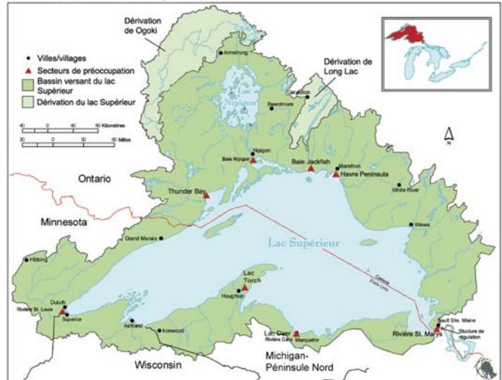
Bassin versant du lac Supérieur

Lake Superior is the world's largest lake by area, and contains 9% of the planet's surface freshwater.