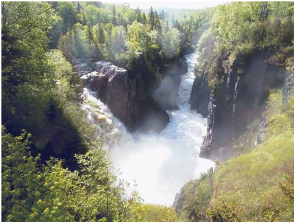
Agassiz River, Ontario

On devrait poursuivre les travaux concernant l'équipement en service contenant des BPC (tels que la sensibilisation de l'industrie) étant donné que l'équipement pourrait être une source de rejets futurs; ce travail devrait se faire en concertation avec d'autres efforts. Il sera probablement plus efficace et efficient d'effectuer le travail relatif à d'autres domaines tels que les BPC coplanaires/apparentés à la dioxine en s'adressant à d'autres forums tels que le Groupe de travail sur les dioxines, ou en se concertant avec de tels forums. Le Groupe de travail sur les BPC cherche actuellement à cerner et à définir les contributions relatives des BPC à l'environnement à partir de sources connues et potentielles de BPC. Une fois les travaux suffisamment avancés, on pourra entreprendre une meilleure détermination des activités à réaliser, et les responsables, afin de réduire les rejets de sources particulières.